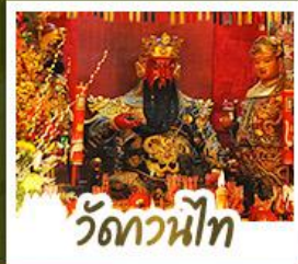
ว้ดกวนน้ท