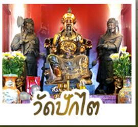
วัดป้กโต