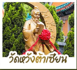
วัดเว้งต้าเซียง