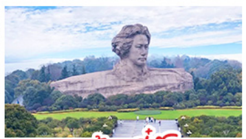
เกาะสั้มจิวฉิ่ง