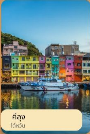
คิง ไต้หวัน