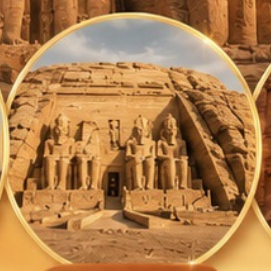
อาบู ซิมเบล