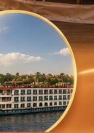
ล่องเรือแม่น้ำไนล์