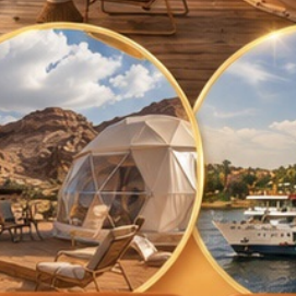
แคมป์กลางทะเลทราย