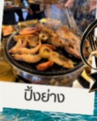
ปิ้งย่าง