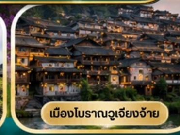
เมืองโบราณฉู่เจียงจ้าย