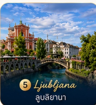
5 Ljubljana ลูบลิยานา