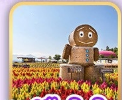
สวนซิกิโซโนะโอะกะ