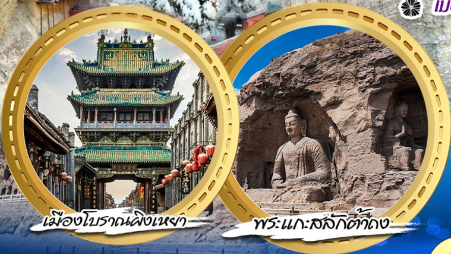
เมืองโบราณผิงเหยา