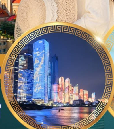
No.3 Bathing Beach

ลานจัดงานเบียร์ชิงเต่า Golden Beach ทางเดินไม้ริมทะเล ศาลเจ้าเทพทะเล ถนนคนเดินโตตง พิพิธภัณฑ์เทศบาลชิงเต่า สวนสาธารณะซิกแนลฮิลล์ ถนนหลงเจียงสู่ กระเช้าภูเขาไท่ผิง ยาน Da Bao island โบสถ์ st.Michael's Cathedral ถนนจงซาน ถนนคนเดินพัลลavy่วน จัตุรัสเมย์ไฟร์