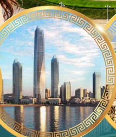
ชมวิวดาคารไฮตัน เซ็นเตอร์