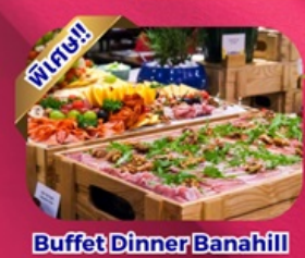
Buffet Dinner Banahill