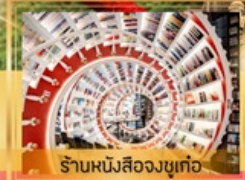
ร้านหนังสือจุกเก๋