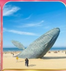
ประติมากรรม "วาฬผู้โดดเดี่ยว"