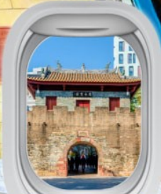
เมืองโบราณหนาวโก