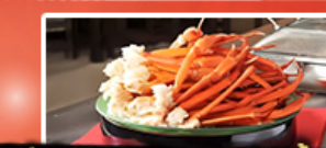
บุฟเฟ่ต์อาหารเย็น + ชาปู 1 มื้อ