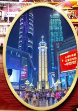
ถนนคนเดินเจี่ยฟางเป็ย