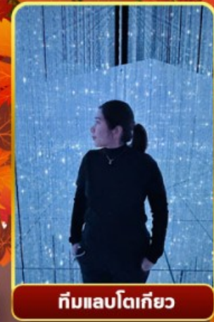
ทีมแอลโตเกียว

ออนเซ็น 2 คั้น นน.กระเป๋า 23 กก.X2 8Days 5Night