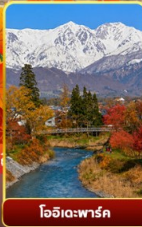
โออิเดะพาร์ค