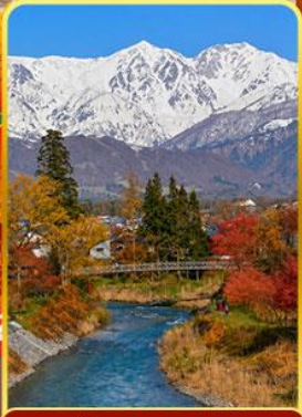
โออิเดะพาร์ค