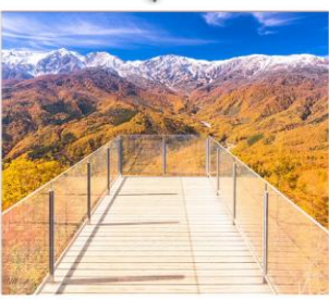
นั่งกระเช้าฮาคุมะ