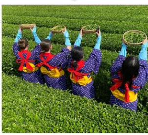
กิจกรรมเก็บชาเมียโนเอ็น