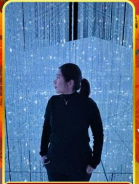
ทีมแลบโดเมียม