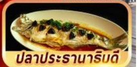
ปลาประรานาริมดี