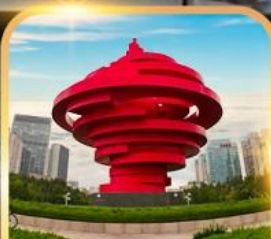
จตุรัสหาลี่