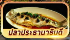
ปลาประรานาภิบัติ