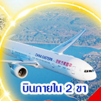
บินภายใน 2 ชม