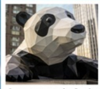
ห้าง IFS แพนด้าป็นตึก