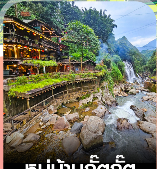
หมู่บ้านก๊วกก๊วก