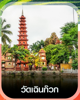
วัดอินทก๊วก

✈️ คอนเฟิร์มออกเดินทาง ทุกพีเรียด 2 ท่านขึ้นไป