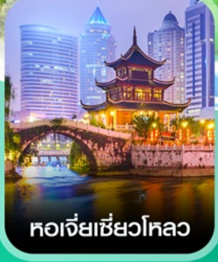
หอเจี่ยเซียงโหลว