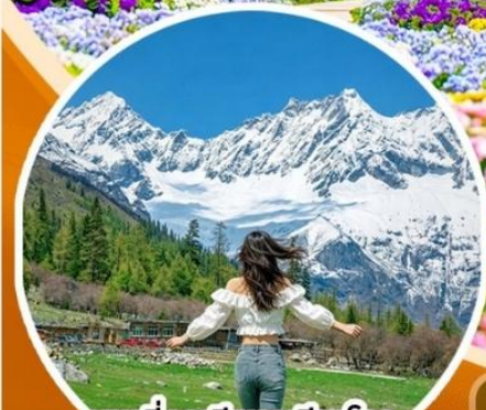
ภูเขาสิดรุณี ช่วงเดียวโกว (รวมรถอุทยาน)