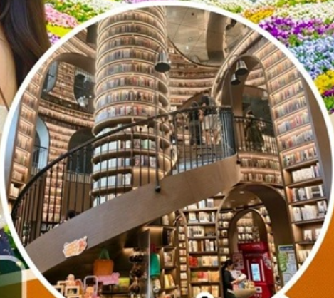
จางชู่เก๋อ