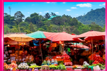
ตลาดดอยมูเซอ