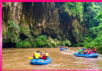
ล่องแก่ง ทีลองจ่อ - ทีลองซู