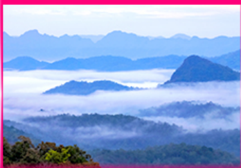
ทะเลหมอก ดอยหัวมด