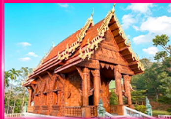
โบสถ์ไม้สักทอง