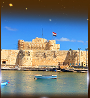
บ่อนประหาร Quite Bay