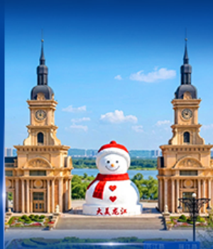
ตึกตาสหะภักย์ ฮาร์ฮิน