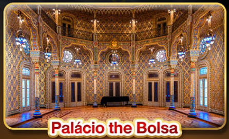
Palácio the Bolsa

📅 เดินทาง : 9 - 18 ต.ค. | 30 พ.ย. - 9 ธ.ค. 69