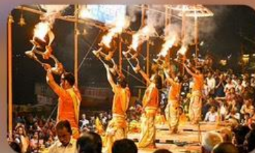
พิธีคงคา อารตี