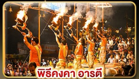
ฟิริงกา อารตี