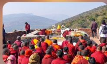
เขาคิชฌกูฏ