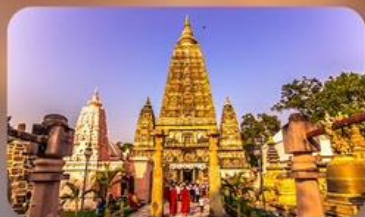
วัดมหาโพธิ์