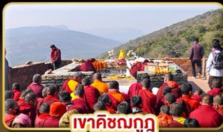
เจฮาชิฆมกุก