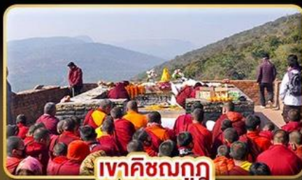
เวทวิชฌกฤ