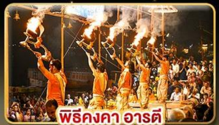
พิธีคองคา อารตี