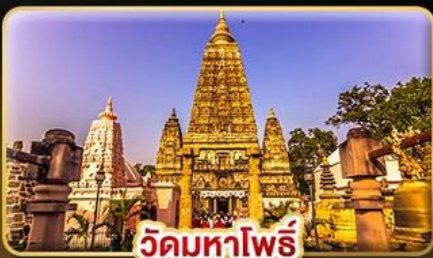
วัดมหาโพธิ์