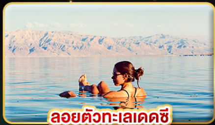
ลอยตัวทะเลเดคซี