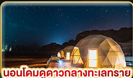
นอนโดมดูดาวกลางทะเลทราย

★ บินตรงสู่ "จอร์แดน" เยือน 7 มหัศจรรย์ของโลก