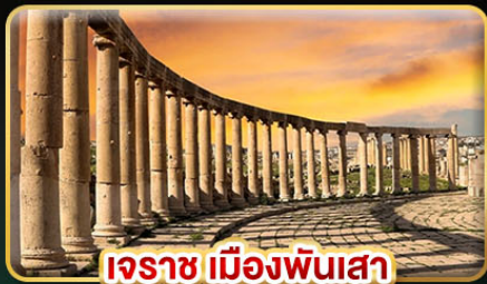
เระชา เมืองพันเสา