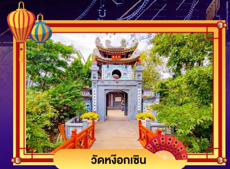
วัดหวังอกเขิน