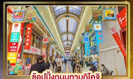
ช้อปปิ้งถนนทานุกุโคจิ