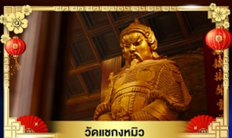
วัดแซงทมิฬ