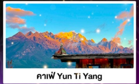
กาแฟ Yun Ti Yang