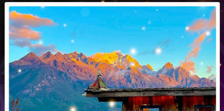
คาเฟ่ Yun Ti Yang