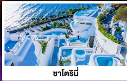
ซาไตรนี่