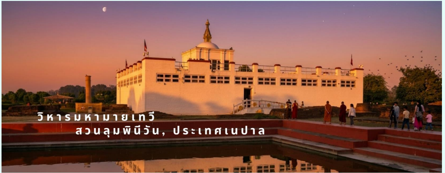
วิหารมหายาเทวี สวนลุมพินีวัน, ประเทศเนปาล

ด้านในวิหารมหายาเทวีไม่อนุญาตให้บันทึกภาพ แต่โดยรอบสวนลุมพินีวัน สามารถถ่ายรูปได้ โดยมีค่าธรรมเนียมกล้องดังนี้ กล้องถ่ายรูปธรรมดา ไม่เสีย กล้องวิดีโอ 10 USD / 800 รูปีอินเดีย / 400 บาท