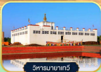
วิหารมายาเทวี