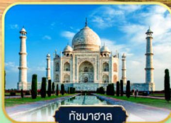
ทัชมาฮาล