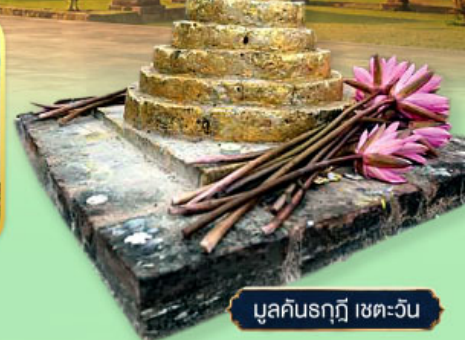
มุลคินรฤฎี เขตตะวัน