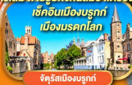
จัตุรัสเมืองบรูจก์