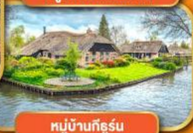
หมู่บ้านก็ธูร์น