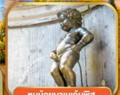
ทูน้อยมานเทินพิส