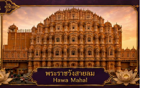
พระราชวังสายลม Hawa Mahal