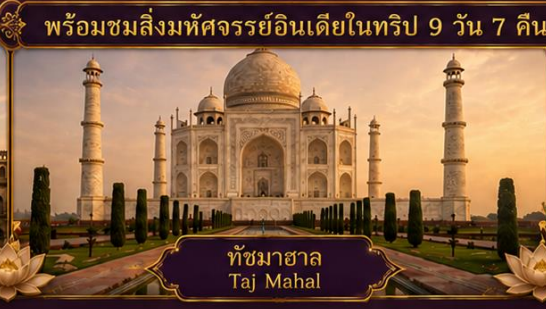
ทัชมาฮาล Taj Mahal