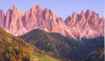
อุทยานแห่งชาติโดโลไมท์