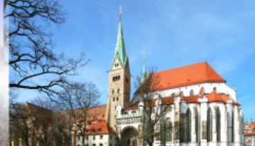
มหาวิหารเอาค์สบวร์ค