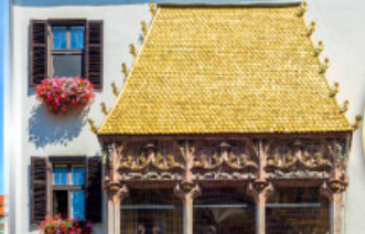
หลังคาทองคำอินน์สbruck