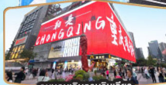
ถนนคนเดินทงยวนเฉียว