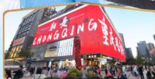
ถนนคนเดินทงยวนเฉี่ยว