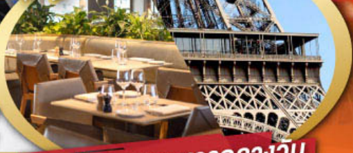
รับประทานอาหารกลางวัน บนหอคอยเฟลา