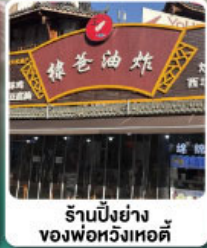
ร้านปิ่งย่างของพ่อหวังเออติ้