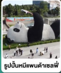
รูปปั้นหมี่แพนด้าเซาฟี่