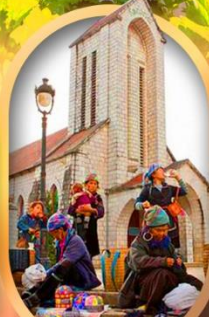
โบสถ์หินซาปา