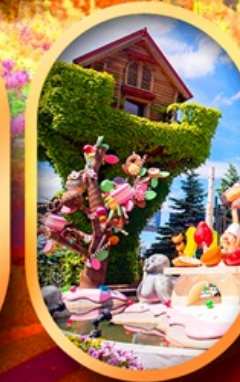
สวนเทพเจ้า