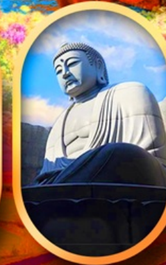
ไดบุตสึเท็นจิ