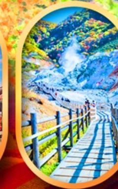
หุบเขานรกจิกอกูดานิ