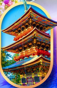
วัดนาริตะ-ซัน