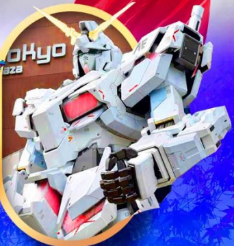
ห้างไอโดปะกับดัม