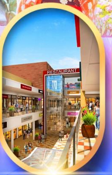
บิตซูเอากี้เล็ท