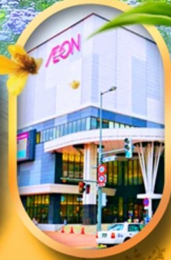
อ็อนมอลล์