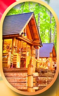
นิงเกิ้ลเกอโร