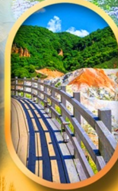
โนโบริเบ็ทสึ