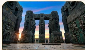
อนุสรณ์ประวัติศาสตร์จอร์เจีย