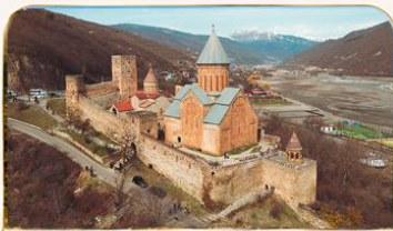
ปิออนานูรี