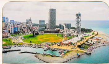
เมืองชายทะเล บาดูมี