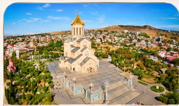
โบสถ์กรินิตี