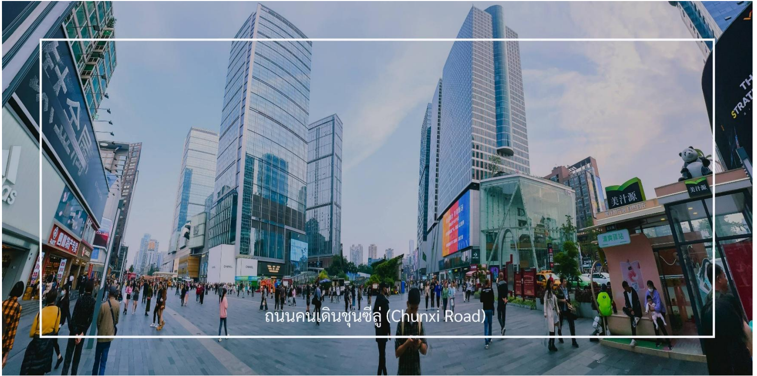
ถนนคนเดินชุนซีลู่ (Chunxi Road)

เดินข้ามถนนมาอีกหน่อย ท่านจะได้ซื้อป๊อง ถนนคนเดินชุนซีลู่ (Chunxi Road) เต็มไปด้วยร้านค้าแบรนด์ชั้นนำทั้งในและต่างประเทศ รวมถึงร้านเสื้อผ้าแฟชั่น รองเท้า อุปกรณ์อิเล็กทรอนิกส์ และของฝาก ถนนคนเดินชุนซีลู่เป็นจุดที่มีความคึกคักและเต็มไปด้วยผู้คน โดยเฉพาะในช่วงวันหยุดสุดสัปดาห์และเทศกาลต่างๆ คุณจะได้พบกับการแสดงศิลปะ การแสดงดนตรี และกิจกรรมที่น่าสนใจ มีร้านอาหารมากมายที่เสิร์ฟอาหารท้องถิ่นและขนมหวานที่หลากหลาย นักท่องเที่ยวสามารถลิ้มลองเมนูพื้นเมืองที่อร่อย เช่น เสี่ยวหลงเปา (ซาลาเปาเนิ่ง) หรือขนมโบราณตามรอยซีรีส์จีนอย่าง มาโลโกว ก็มีเช่นกัน