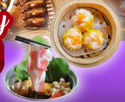
วัดเขกงหนิว