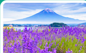
สวนโออิชิพาร์ค